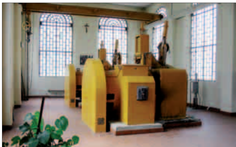
La turbina che dall'Acsm di Primiero è stata spedita al missionario trentino in Bolivia

Le due macchine donate hanno una potenza di 800 kW ciascuna. La produzione media dell'impianto è di circa 8 milioni di kWh annui. Tenendo conto che il consumo medio di elettricità annuo di una famiglia italiana corrisponde a circa 2.700 kWh, l'impianto è in grado di coprire il fabbisogno medio