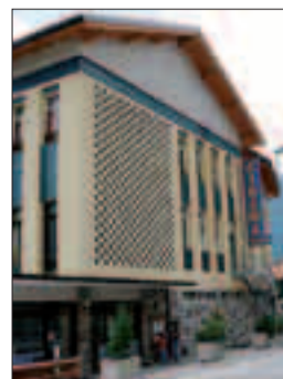
Castello, il cinema teatro

CASTELLO TESINO - Oltre 20 mila euro. È quanto, nei giorni scorsi, la giunta comunale ha assegnato come contributo ordinario alle associazioni culturali, ricreative e sportive del paese. Ecco, in dettaglio, le somme erogate. Coro Giovanile 500 euro, Acli Borgo 200 euro, Gruppo Folk 1.350 euro, Centro Tesino di Cultura 650 euro, Associazione per la Comunicazione Sociale 1.200 euro, Banda Sociale Folk 1.900 euro, Castello Tesino Notizie 950 euro, Unione Astrofili Tesino e Valsugana 750 euro, Compagnia Teatrale S. Giorgio 600 euro, Coro Parrocchiale Anziani 300 euro, Pro Loco 2.000 euro, Associazione Stella Polare 600 euro, Tesino Abbraccia Chernobyl 500 euro, Avis Castello Tesino 775 euro, Circolo Anziani e Pensionati 700 euro, Sat del Tesino 600 euro, Ski Team Lagorai 1.700 euro, Unione Sportiva Tesino 2.400 euro, Gs Tesino Calcio a 5 1.700 euro. In tutto sono state venti le richieste accolte che sono arrivate al Comune entro i termini previsto. M.D.