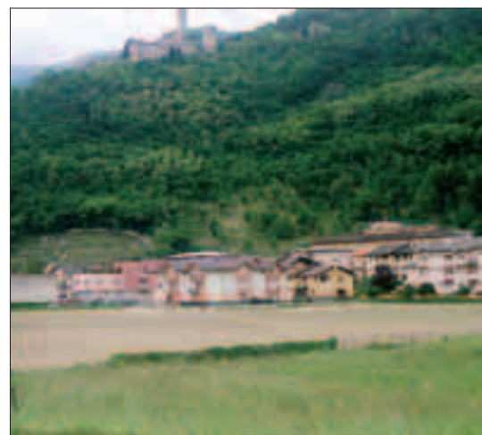
Veduta dell'area dove dovrebbero sorgere le elementari

La Valdastico Consiglio comunale alle 20.30. Ordine del giorno urgente: messa in sicurezza della S 47 e realizzazione della «Pirubi».